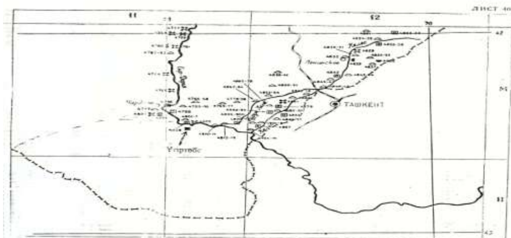
I — Сызба. Археологиялық картада Үтір төбе қаласы.

Ұтырлы (Үтіртөбе) қаласын Қазақстан археологтары зерттемеген. Оның басты себебі - Мырзашөл өңірі, оның үлкен бір бөлігі - Мақтарал ауданы 1963-1971 жылдары Өзбекстан Республикасына қараған. Сондықтан да бұл аймақ өткен ғасырдың 60 жылдары жүргізілген Шардара археологиялық экспедициясының зерттеу аясынан тыс қалған. Бұл ортағасырлық қала тіпті, Қазақ Совет энциклопедиясы, Археологическая карта Казахстана (Алматы, 1960), Свод памятников истории и культуры Казахстана в Южно-Казахстанский область (Алматы, 1994) атты іргелі басылымдарға да кірмей қалған. Үтіртөбені алғаш зерттегендер Өзбекстан археологтары. Қала туралы алғашқы деректі 1971 жылы Ю.Ф. Буряков пен О.М.Ростовцев жазған [3]. Ю.Ф.Буряков «Историческая топография Ташкентского оазиса» - деген монографиясында Чинакент (Шыназ) қаласынан 30 шақырым жерде Сырдарияның сол жағалауындағы «Ұтырлы» қаласын атап өтеді [4]. Жазушы М.Жақып «Мырзашөлім - мырза елім» (Алматы, 1998) деген еңбегінде бұл қала жөнінде шағын түсініктеме береді [5].